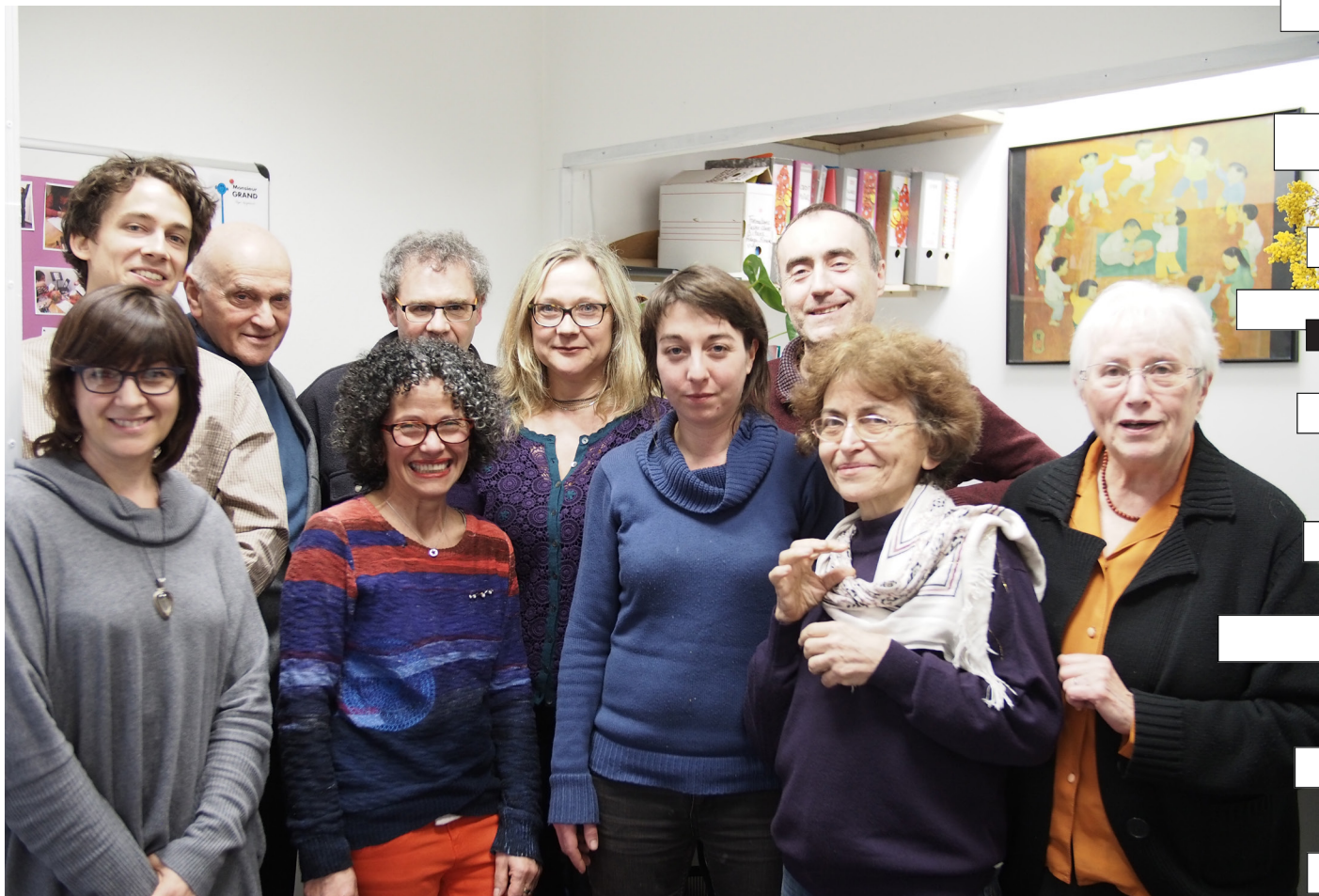
Association Marie Jaëll